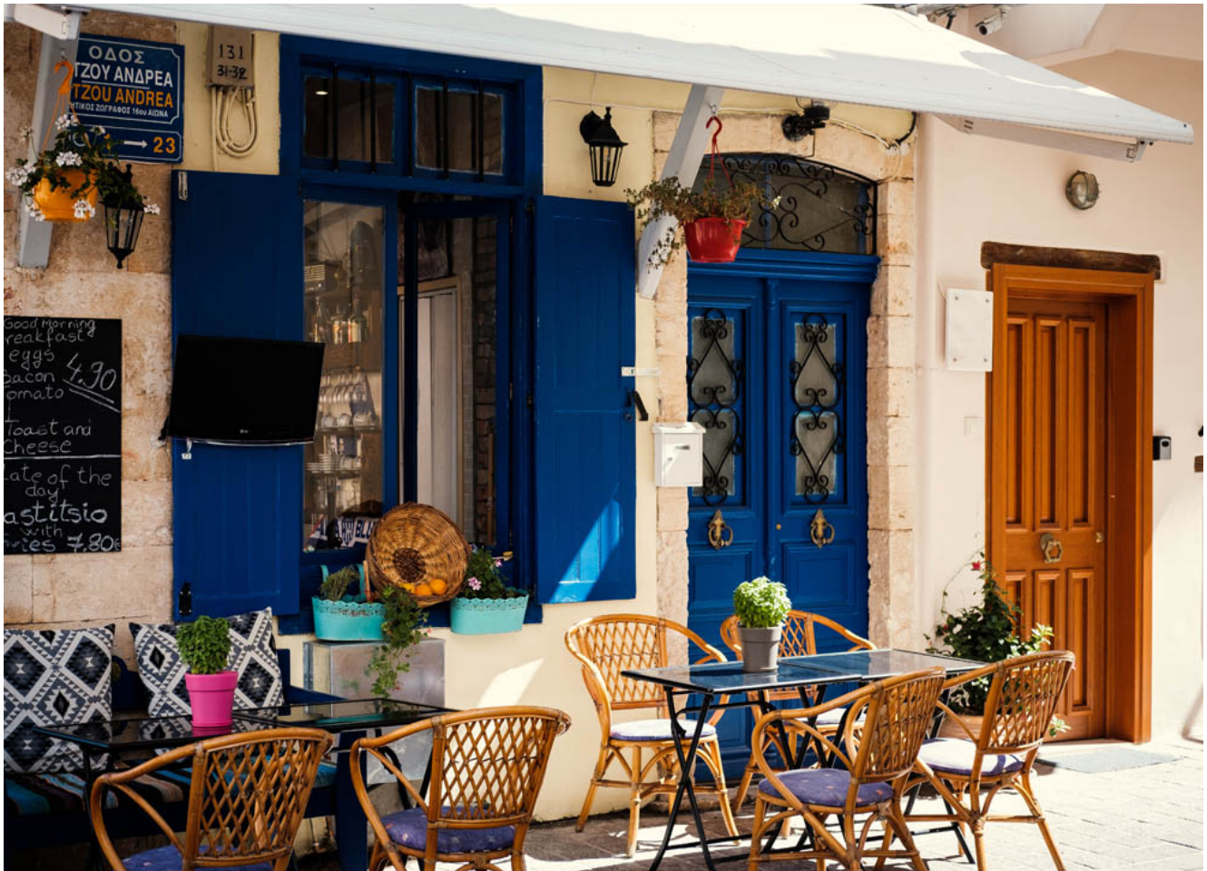
Een pittoresk café op Kreta