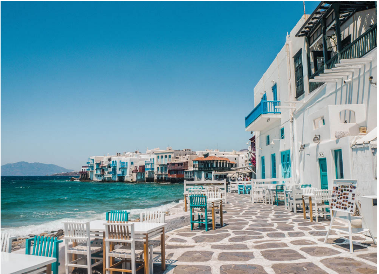
Het prachtige Mykonos

De schilderachtige witte huisjes en rotsachtige heuvels typeren het eiland Mykonos. Wanneer je vliegt vanaf Schiphol Airport kun je met een directe vlucht naar dit Griekse eiland vliegen. Vanaf de andere Nederlandse luchthavens kun je ook reizen naar Mykonos, maar dan met een tussenstop.