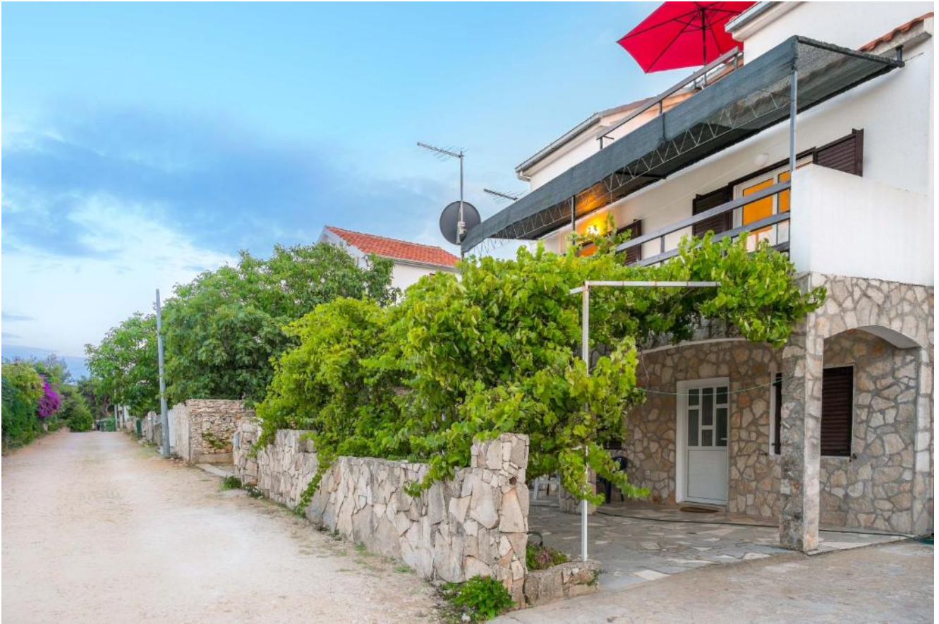
Park Plava Laguna