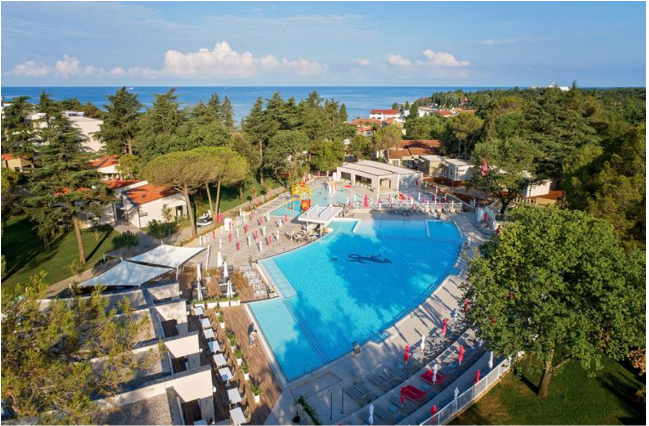
The Sea House Apartments