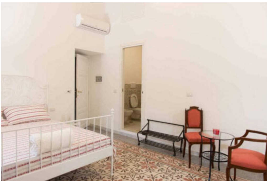
B&B Domus Aurea