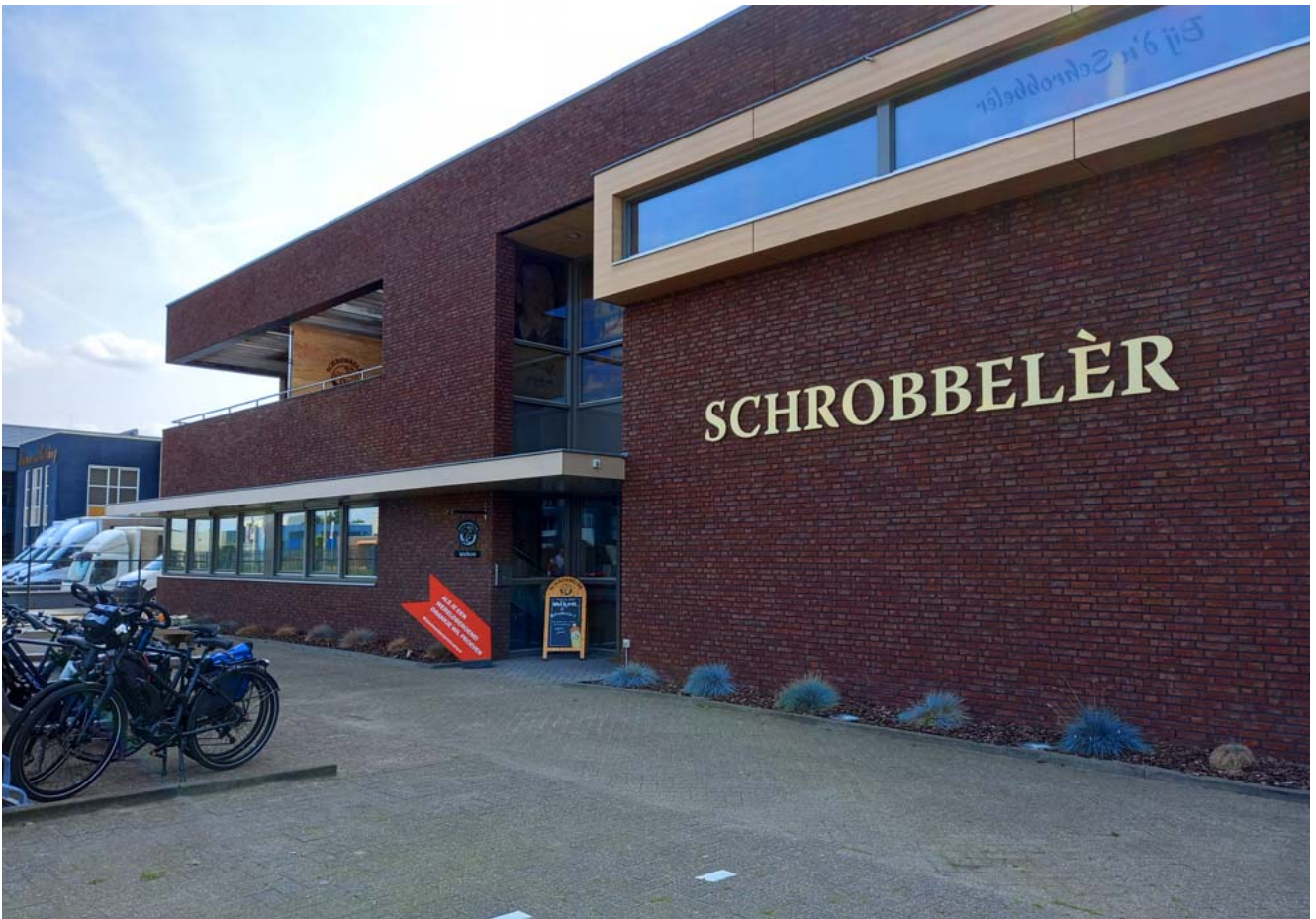
Op één van de industrieterreinen van Tilburg ligt dit uitje,