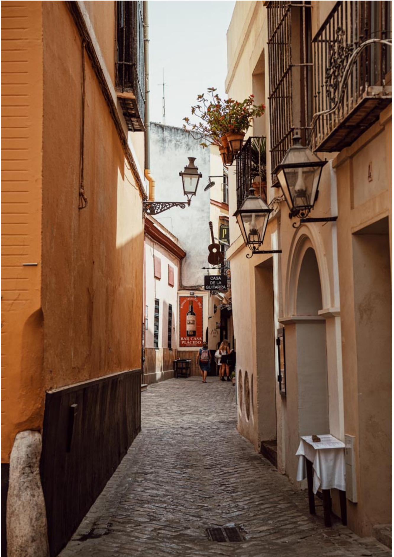
De wijk Santa Cruz is de voormalige Joodse wijk van Sevilla.