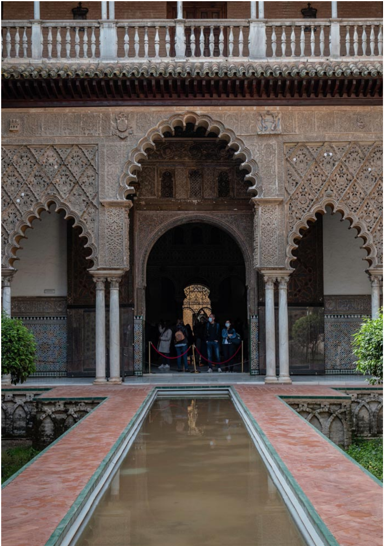
De Real Alcázar de Sevilla is het koninklijk paleis van